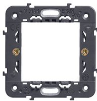
21602 - Frame 2M +claws 71mm