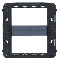
21618 - Frame 8M with screws