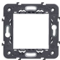
21603 - Frame 2M without screws 71mm