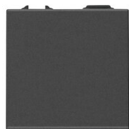
09013.2.CM - 1P 16AX reversing switch 2M carbon matt