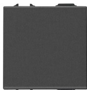
09008.2.CM - 1P NO 10A 2M push button carbon matt