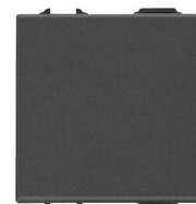
09013.2.CM - 1P 16AX reversing switch 2M carbon matt