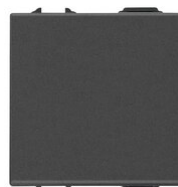
09001.2.CM - 1P 16AX 1-way switch 2M carbon matt