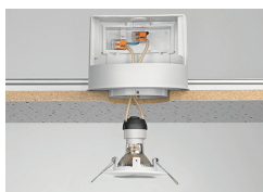
Custom low-voltage lighting system