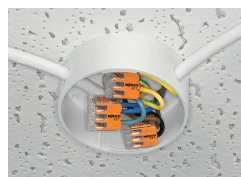
Lighting distribution in a ceiling canopy