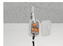
Pendant light connection in a suspended ceiling